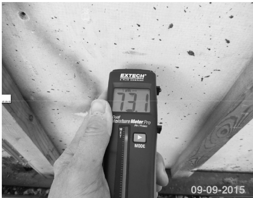
Vindspærre under vindue er kraftigt opfugtet. 73,1%

Overgangen mellem taget og ydervæggen på en bygning skal sikres mod vandindtrængen ved hjælp af en såkaldt vindskede. Uden en vindskede vil slagregnen presses ind i fugerne mellem taget og ydervæggen. I Uglevænget har man projekteret,