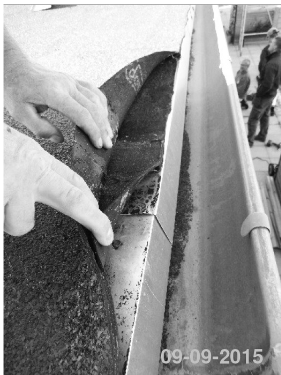
Ringe vedhæftning/klæbning af underpap på fodblik

Den kommende til vil vise om dette er tilstrækkeligt til at rette op på de byggeskader, der er konstateret i Uglevænget.