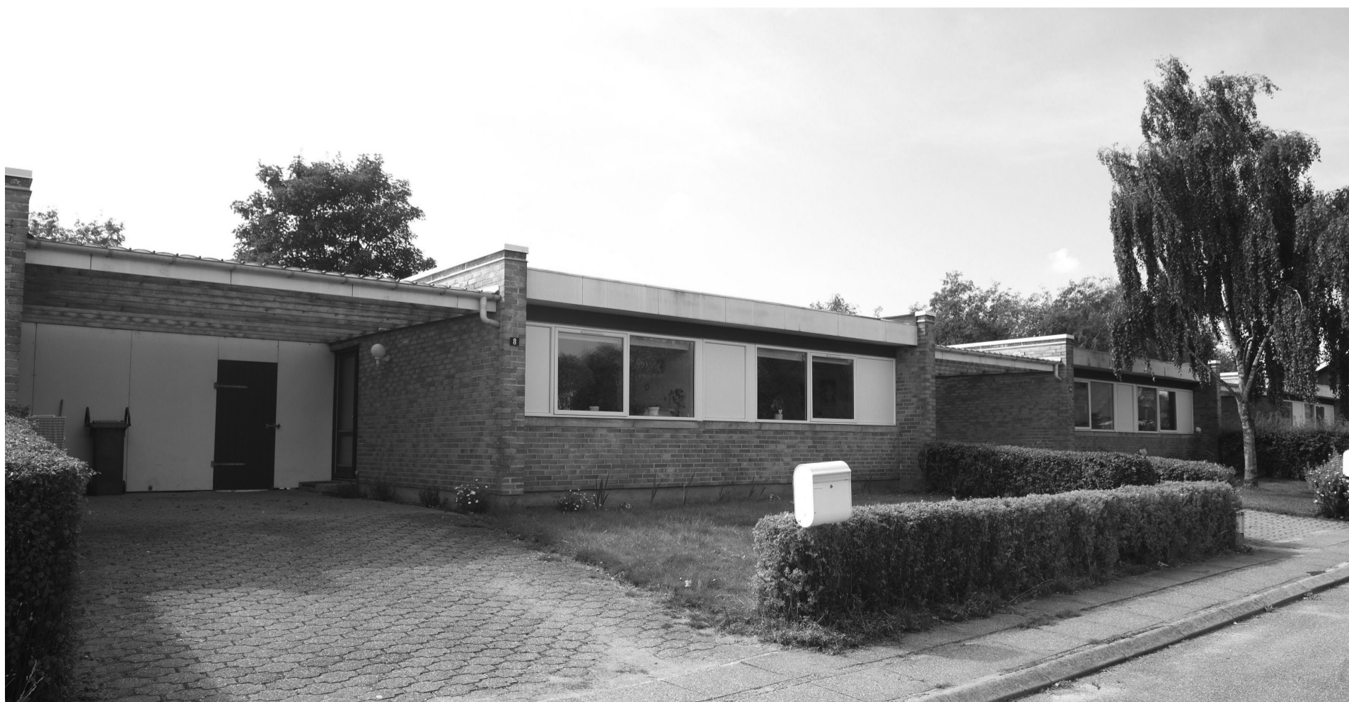
Rækkehus fra 1975 i Spjald, med en husleje på ca. 700 kr pr. m 2 , årligt. Huset er ikke beliggende i den afdeling, som omtales i artiklen.

Ingen kan være tjent med små byer som Spjald affolkes.