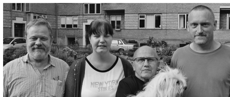
Fra venstre til højre:

Som formand for beboerforeningen vil jeg gerne sige tak til mine særdeles hjælpsomme og hensynsfulde naboer og en tak til Randers lejerforening.