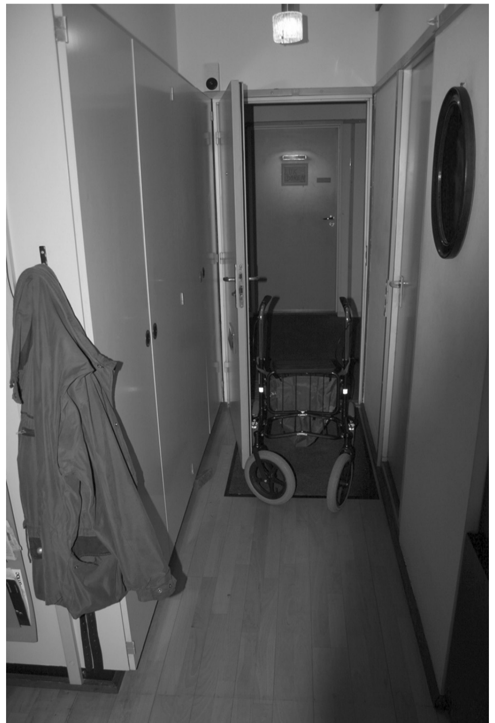
Lejlighederne er for trange, når beboerne får brug for rullestol og rollator

Dette er kollektivhusenes udfordring. Mange af dem må formentlig ombygges eller få en ny status som boliger for uddannelsessøgende eller andre med mindre pladskrav.