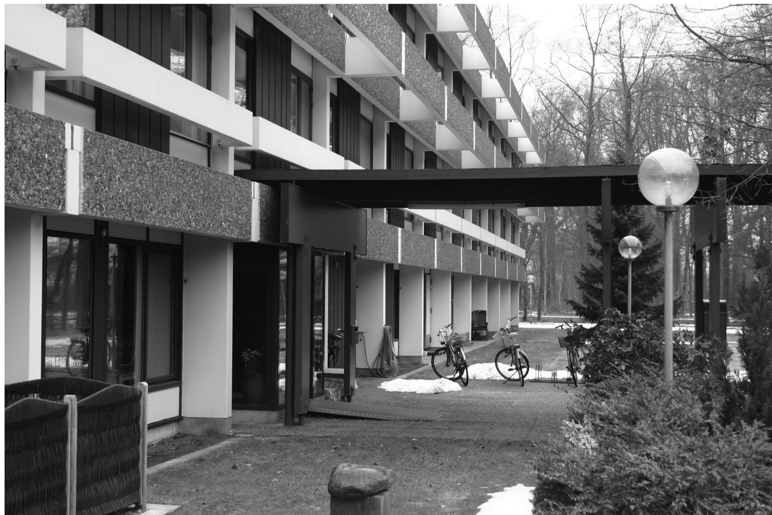
Sandmarksbo i Køge. Opført i 70-erne.

Lejerne fik dog en lille indrømmelse. Udlejer anerkendte at én bestemmelse i lejekontrakten ville bortfalde fremover. Det var bestemmelsen om at spisepligten kunne udvides til 1 hovedmåltid om dagen. Hvis udlejer ikke havde givet denne indrømmelse på forhånd, er det meget tænkeligt, at landsretten ville have vurderet sagen anderledes.